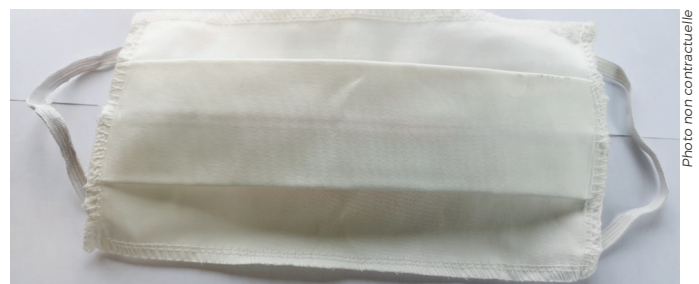
Deux masques en tissu, répondant aux recommandations AFNOR, seront distribués à tous les Morangissois à partir de fin mai.

Dans ce désordre, la Municipalité s'est associée à un groupement de commande de plusieurs Établissements publics territoriaux et de nombreuses villes du « Grand-Orly Seine Bièvre » auprès d'une entreprise exerçant son activité dans le territoire. La certification du processus de cette entreprise a mis plus de temps que prévu et les 14 500 masques commandés n'arriveront que fin mai, début juin. Dans le même temps, le Conseil départemental a commandé un masque par Essonnien, pour les Morangissois ils seront livrés fin mai. Nous organiserons donc une distribution commune de deux masques en tissu par habitant, fin mai, début juin.