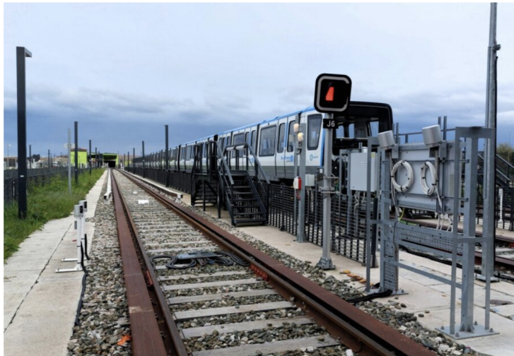
Aujourd'hui ville accueillant le site de maintenance et de remisage de la ligne 14 du métro, la ville de Morangis souhaite accueillir une station de la ligne 14 du métro. Le prolongement jusqu'à la ville essonnienne a été inscrit dans le nouveau directeur de la Région Île-de-France.

Le nouveau Schéma directeur de la Région Île-de-France voté mercredi les élus franciliens compte plusieurs projets de transports qui améliorer la desserte de l'Essonne.